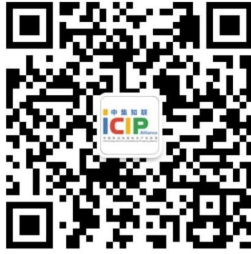
中集知联微信二维码